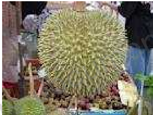
2. a durian