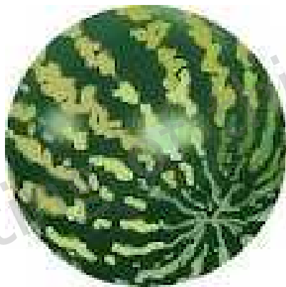
1. a water melon