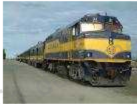
2. a train