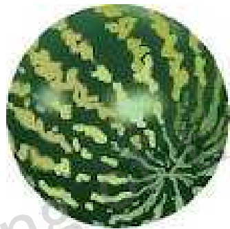
1. a water melon 1つのスイカ