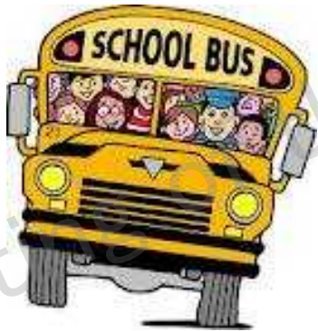
1. a school bus