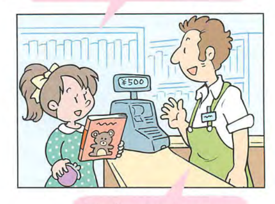
It's five hundred yen.