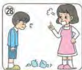
sorry / angry