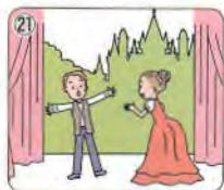
actor / actress

いろいろなことをしている人たちが いるねえ。きみはしょうらいどんな ことをしたいかな？