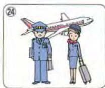
pilot / flight attendant