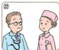
doctor / nurse