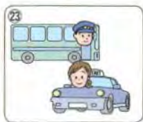
bus driver / taxi driver